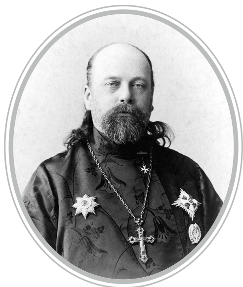
Священник Леонид Чичагов. После 1894 года