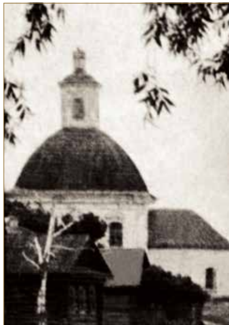
Церковь в честь Вознесения Господня в селе Кузятове до разрушения