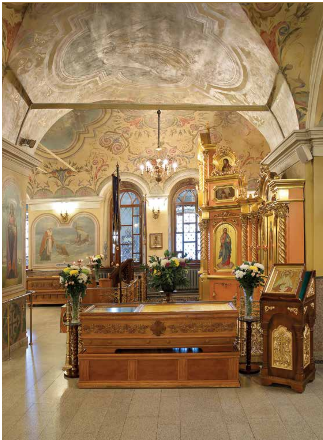
Рака с мощами преподобноисповедницы Матроны (Власовой) в Казанском соборе. 2019 г.