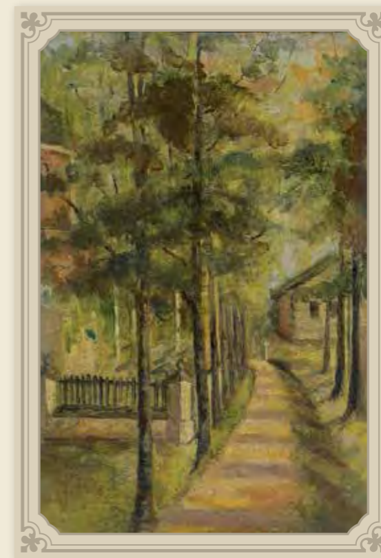
Святая Канавка. Старинный рисунок

По свидетельству сестер, Канавку начал рыть сам отец Серафим, тайно от них, ночью, видя, что они все откладывают ее рыть. Много чудесного связано с этим событием. Перед самым праздником Святой Троицы одна из первых двенадцати сестер была у батюшки Серафима в пустынке, а он ей и говорит: «Гряди, гряди, матушка, скажи девушкам, пусть сегодня начинают Канавку рыть: я был там и сам начал рыть ее!» «Иду я, – повествует монахиня, – и думаю: как же это батюшка-то говорит-то, что был! Должно быть, ночью ходил. Прихожу и рассказать еще не успела, а сестры встречают меня, рассказывают, как на заре видели батюшку, как, обрадовавшись, бросились было к нему, а он и пропал, вдруг стал невидим, а