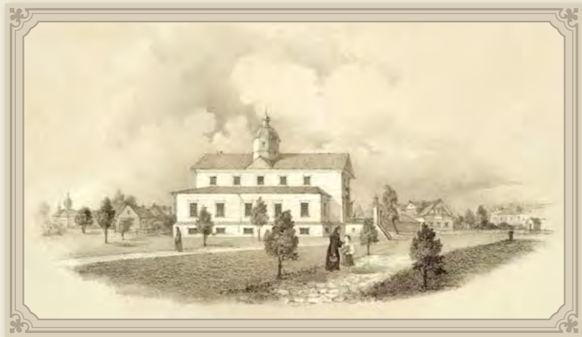
Тихвинская церковь в Серафимо-Дивеевском монастыре. Старинная литография