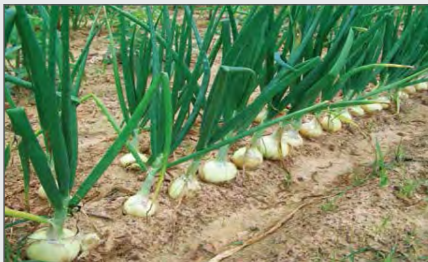
Преподобный Серафим питался одними овощами со своего огорода. Это были картофель, свекла, лук и трава, называемая сныть.

вых ревнителей христианской веры Египта, Палестины, Иерусалима, Сирии, читал их жизнеописания, беседы и проповеднические труды, так и с подвигами отечественных подвижников. Поэтому в 1794 году он попросил благословение настоятеля обители «на жизнь пустынную или отшельническую, в подражание древним пустынножителям». Позднее он часто говаривал: «Нам запрещают жить в пустыне; но первый наш отец, Иоанн Предтеча, был пустынный».