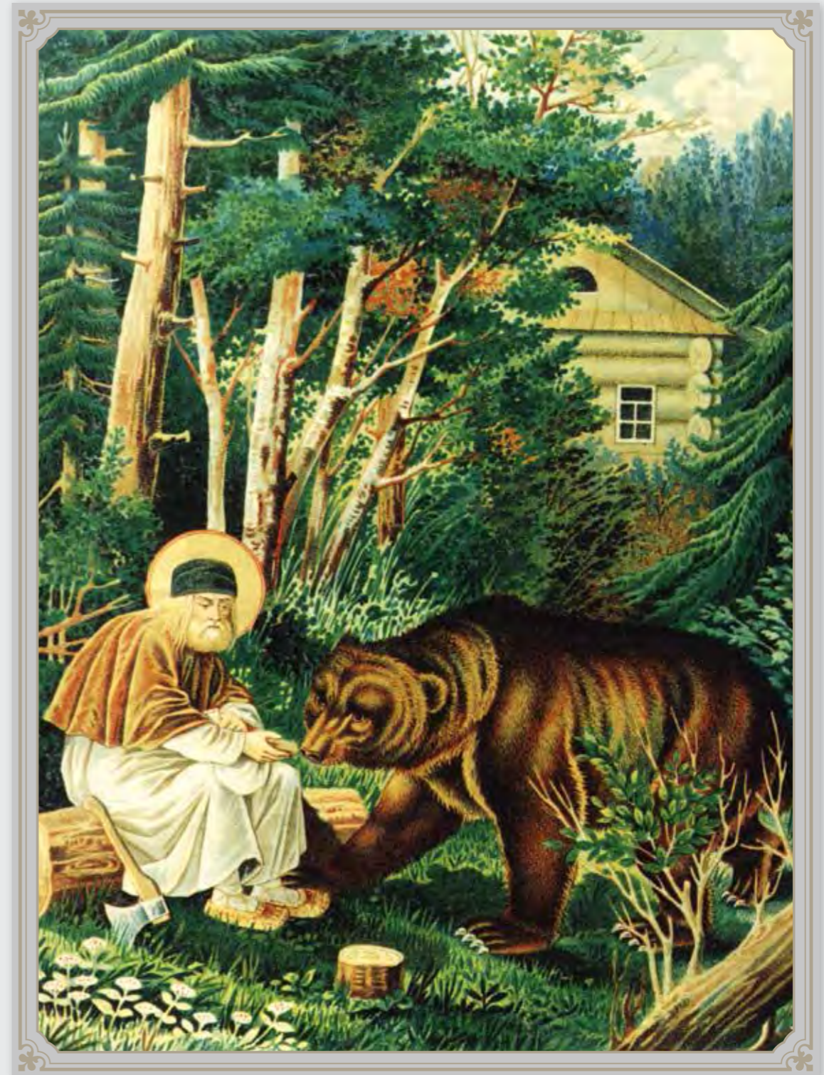
Из недельной своей порции хлеба батюшка Серафим часть уделял пустынным животным и птицам, которые были приласканы старцем, очень любили его и посещали место его молитвословий

Правила этого пустынного монастыря были строгими – в духе древнехристианских общежительных монастырей, по примеру которых иноки все делали своими руками. Последние исследования показали, что основатели обители ориентировались на традиции Северной Фиваиды и использовали уставы Кирилла Белозерского, Корнилия Комельского, Евфросина Псковского и других святых подвижников Русского Севера. Уставные положения сыграли большую роль в формировании высокого духовного уровня обители, и к концу XVIII века пустынь прославилась своим подвижничеством и традициями старчества. Таким образом, пу-