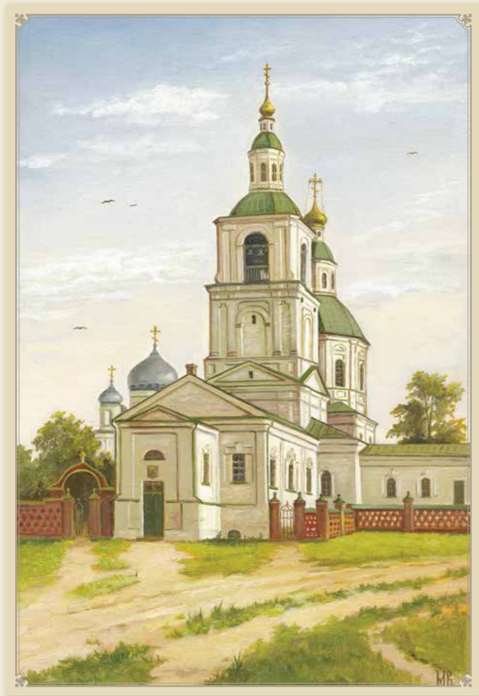
Казанская церковь села Дивеева. Конец XIX в.

Мы со всех сторон обошли Казанскую церковь, к колокольне которой, с западной стороны, пристроена двухэтажная церковь: верхняя – во имя Рождества Христова, нижняя, под ней подкопанная, с низкими сводами, поддерживаемыми четырьмя столбами, – во имя Рождества Пресвятой Богородицы.