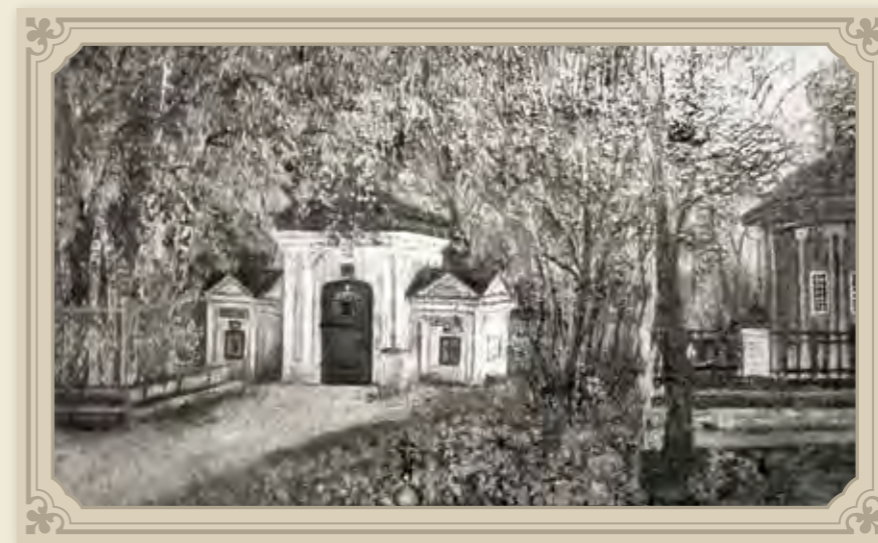
Дивеевское монастырское кладбище. Старинный рисунок

В Казанскую церковь входы с боков, так что в обе церкви можно войти свободно. Церковь во имя Рождества Христова, законченную в 1829 году, отец Серафим настаивал обязательно освятить в праздник Преображения Господня, как бы этим желая испросить для зарождающейся общины преобразующую