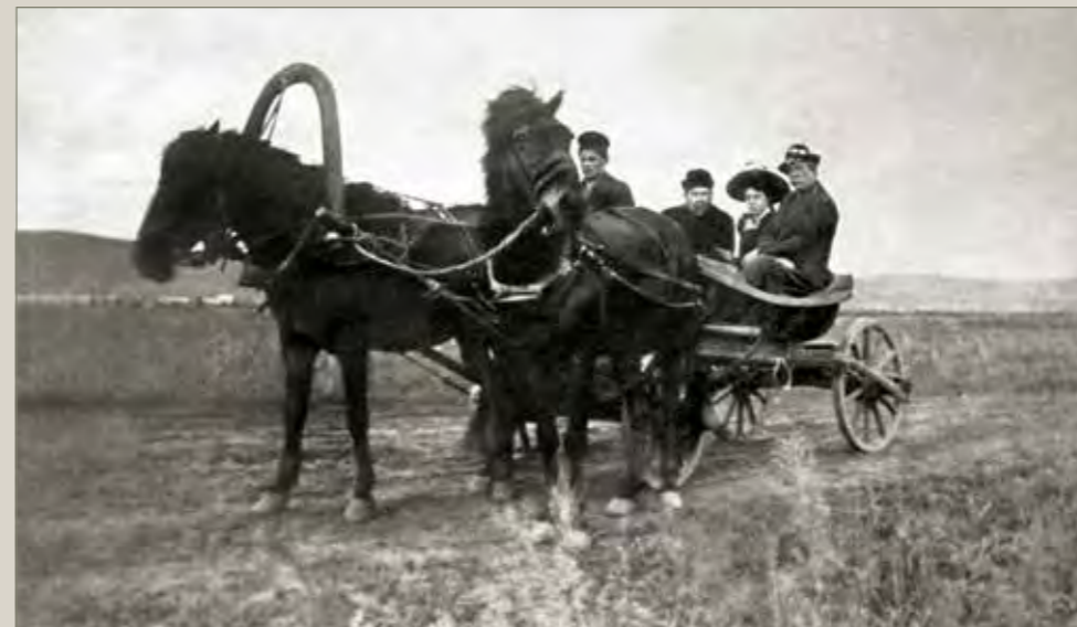
Благородные путешественники в XIX веке

няют», а потом отпустит руку: «А так снова возносят их к небу».