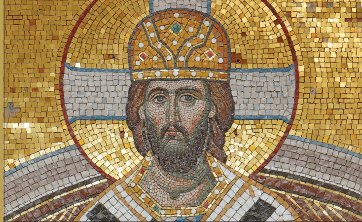
Фрагмент иконы «Господь Вседержитель». Горнее место главного алтаря