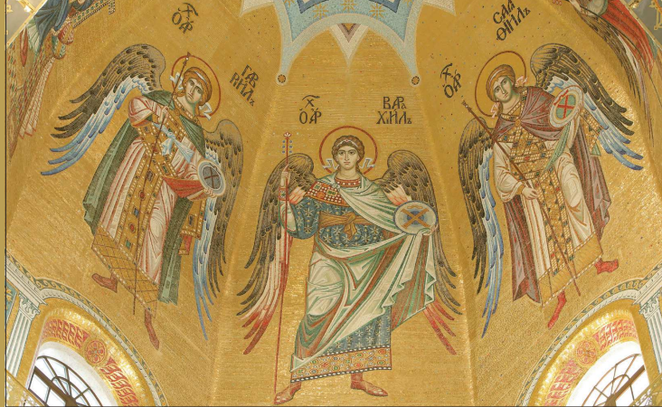
Архангелы в главном куполе Благовещенского собора