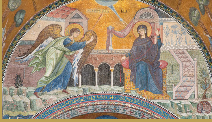
Благовещение Пресвятой Богородицы. Главный алтарь