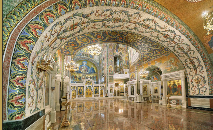
Вид центрального нефа от западного входа