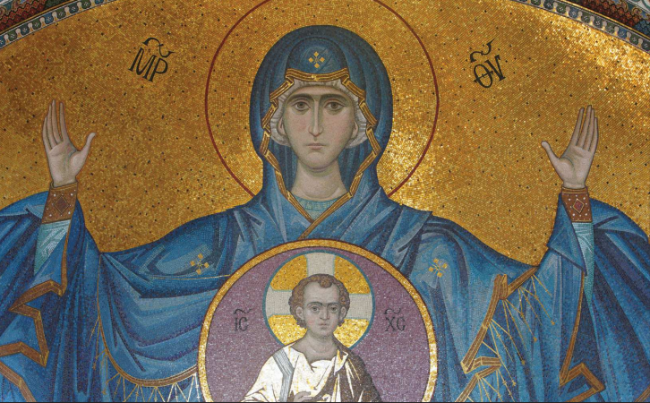
Фрагмент иконы Пресвятой Богородицы «Знамение». Конха главного алтаря