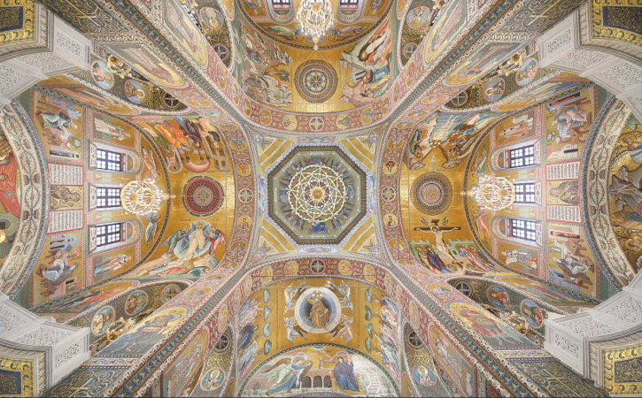
Купол и своды Благовещенского собора