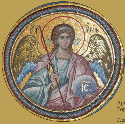
Архангел Михаил. Горнее место главного алтаря Главный алтарь Благовещенского собора