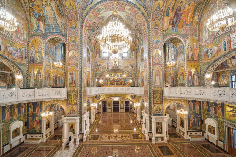
Интерьер центральной части Благовещенского собора: вид из алтаря (слева) и вид от главного входа (справа)